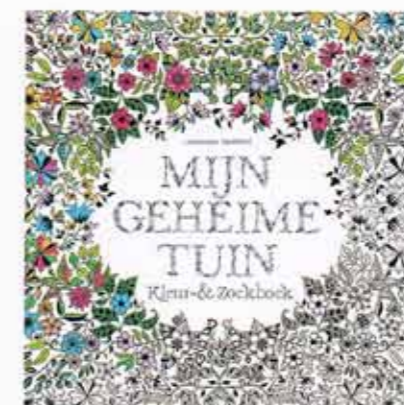
De eersteling van THOTH