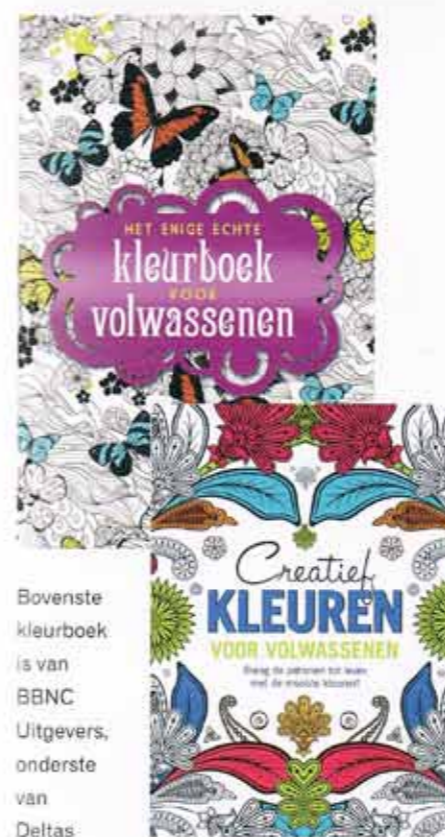
Bovenste kleurboek is van BBNC Uitgevers, onderste van Deltas