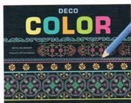
Uitgaven van Deltas