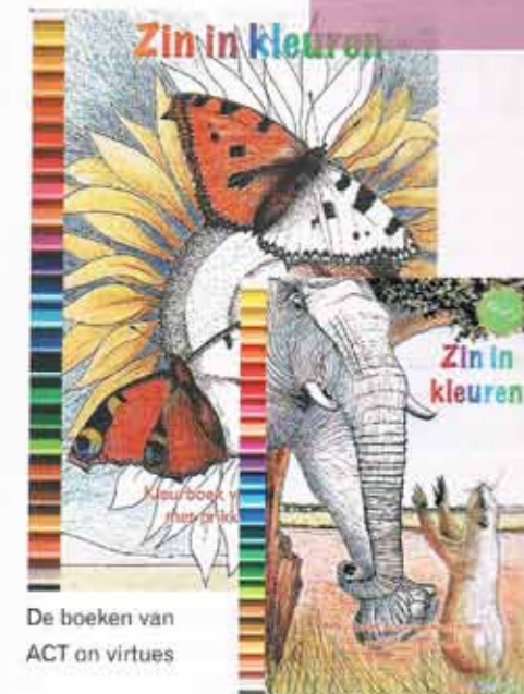
De boeken van ACT on virtues